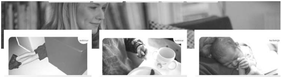
WEBINAR BOOS – maandag 10 oktober 2022

Je kunt deze webinars volgen via je computer, tablet of telefoon. Inschrijven kan via goedgezind.be/dossiers/webinars . Je kan er ook heel wat voorbijje webinars herbekijken.